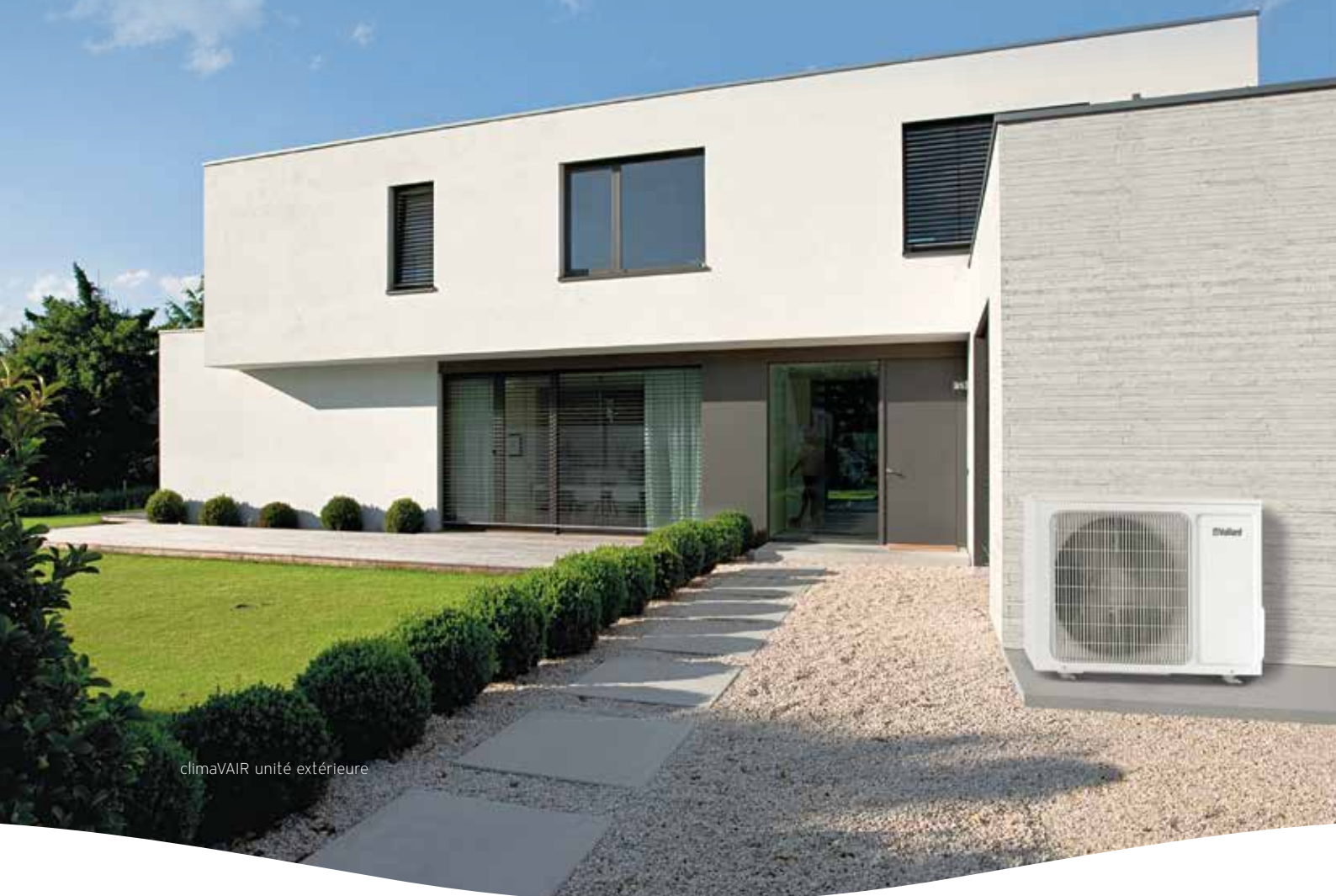
climaVAIR unité extérieure

Optimaal interieurklimaat en efficiëntie in alle seizoenen