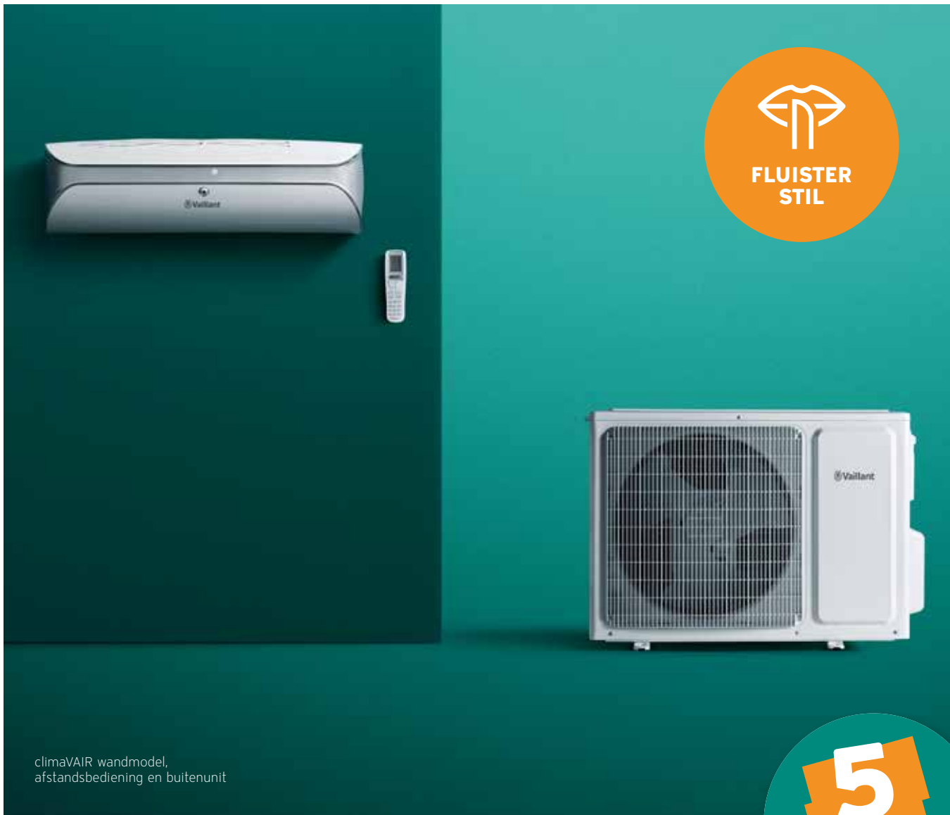
climaVAIR wandmodel, afstandsbediening en buitenunit

In februari 2022 breiden wij het climaVAIR-gamma uit met 3 monosplits van topkwaliteit onder de passende naam 'climaVAIR premium'. Deze modern vormgegeven toestellen, met een vermogen van respectievelijk 2,5, 3,5 en 5 kW, hebben een aantal extra troeven die het comfort in huis alleen maar ten goede komen. Naast hun hogere efficiëntie zorgen de grotere binnenunits, in combinatie met de 3D-luchtstroomregeling, voor een nog betere verspreiding van de lucht in uw woning. Ze onderscheiden zich ook door hun nog lagere energieverbruik en uiterst stille werking, met een geluidsdruk van amper 19 dB(A). Vergeleken met de bestaande reeks is de wifi-module hier geen accessoire, maar geïntegreerd in het toestel. Een handige nieuwigheid ten slotte is de infrarood-aanwezigheidsensor: met de 'I sense'-functie daarvan kan u het apparaat zodanig instellen dat de lucht naar keuze in uw richting, van u weg of om u heen wordt geblazen. De vijfjarige garantie op het volledige toestel maakt het plaatje compleet!