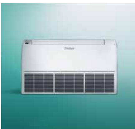
climaVAIR vrijstaand vloer- of wandmodel

Dan wordt het bovenstaande proces omgedraaid.