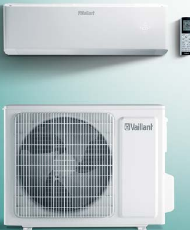
climaVAIR modèle murale, télécommande et unité extérieure

Climat intérieur optimal et efficace en toutes saisons