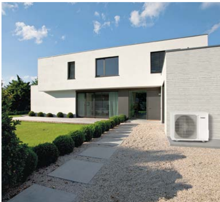
climaVAIR unité extérieure