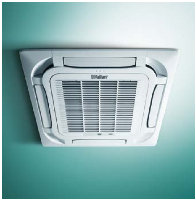
climaVAIR modèle intégré