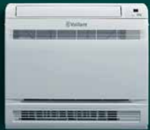
Consoles au sol