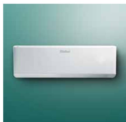
climaVAIR unité intérieure