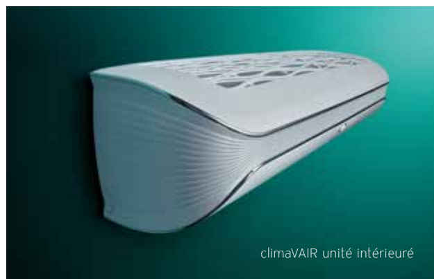
climaVAIR unité intérieure