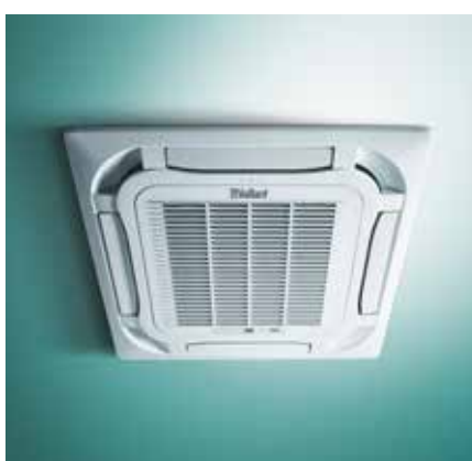
climaVAIR modèle intégré