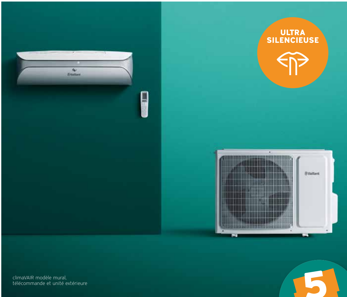
climaVAIR modèle mural, télécommande et unité extérieure

Dès le mois prochain, notre gamme climaVAIR va s'enrichir de 3 monosplits de haute qualité, les 'climaVAIR premium'. Ces appareils au design moderne, d'une puissance de 2,5, 3,5 et 5 kW, présentent une série d'atouts supplémentaires qui améliorent sensiblement le confort de la maison. Outre leur efficacité renforcée, ces unités intérieures, associées au réglage du flux d'air 3D, assurent une parfaite distribution de l'air au sein de votre habitation. Elles sont très peu énergivores et particulièrement silencieuses, à peine 19 dB(A). Autre nouveauté par rapport à la série existante : le module Wi-Fi est désormais intégré à l'appareil. Par ailleurs, la fonction 'i sense' du capteur de présence infrarouge permet d'orienter le flux d'air dans la direction de votre choix : vers vous, loin de vous ou autour de vous. Et pour couronner le tout, l'ensemble de l'appareil bénéficie d'une garantie de 5 ans.