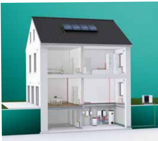
Demande de chaleur par pompe à chaleur et chaudière

Il s'agit de la combinaison d'une pompe à chaleur et d'une chaudière classique. Avec le chauffage hybride, vous utilisez des combustibles fossiles, comme le gaz naturel ou le mazout, ainsi que des énergies renouvelables. Le système se base sur une régulation intelligente pour estimer quelle source de chaleur est la plus efficace et la moins chère à un moment donné. Les coûts du gaz, mazout et de l'électricité sont également pris en compte. Si, par exemple, la demande de chaleur est trop élevée ou si la température extérieure est trop basse, la chaudière se mettra en marche. Dans d'autres cas, la pompe à chaleur sera la source d'énergie privilégiée.