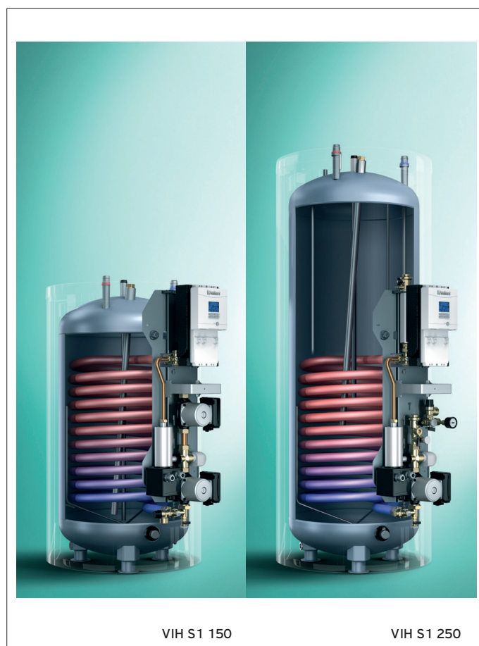
VIH S1 150