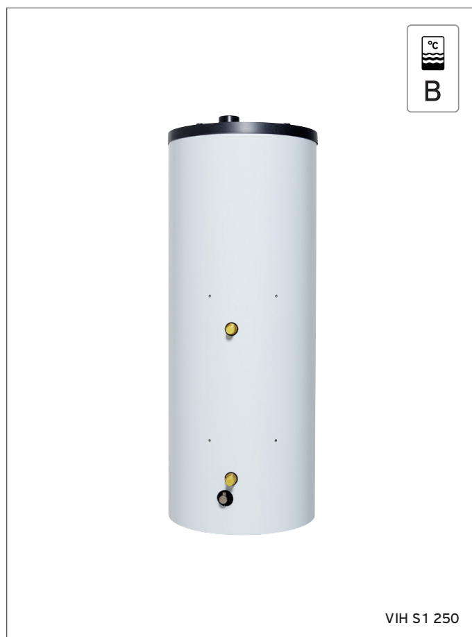
VIH S1 250