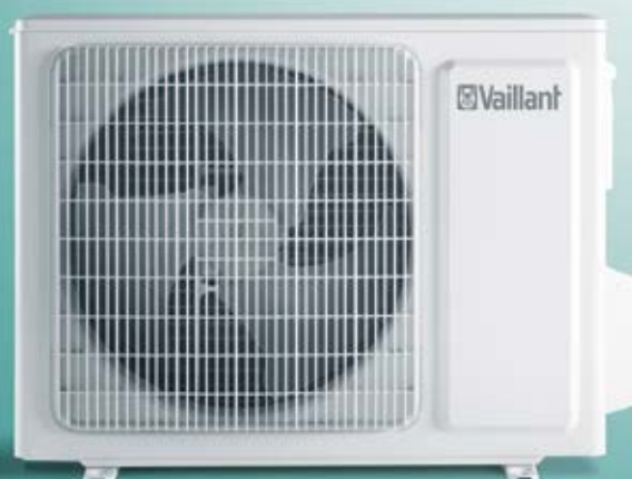
climaVAIR wandmodel, afstandsbediening en buitenunit